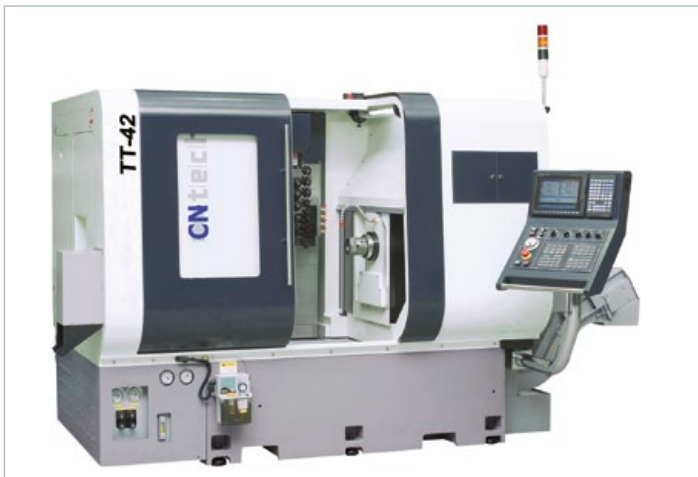
LE MODÈLE TT-42